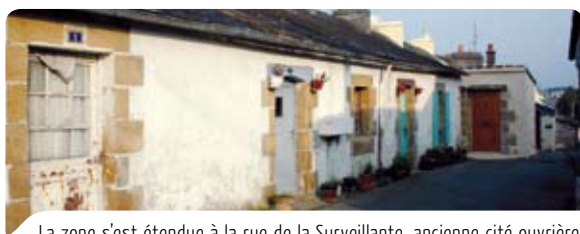
La zone s'est étendue à la rue de la Surveillante, ancienne cité ouvrière.

Afin d'aider les Quimperlois dans ces démarches, une permanence a lieu toutes les 3 semaines au service urbanisme de la ville. L'Architecte des Bâtiments de France conseille et oriente les demandeurs sur le choix architectural, en vue d'assurer la cohérence avec le patrimoine existant et en assurer la protection.