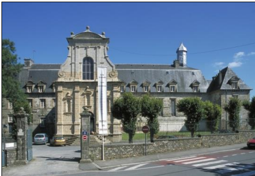
Chapelle des Ursulines, Classé Monument Historique, entrée des visiteurs

Depuis 1996, la Ville de Quimperlé a décidé d'organiser des expositions dans cet espace restauré qui comprend la chapelle elle-même et, perpendiculairement, le chœur des religieuses. La municipalité souhaite dédier ce lieu d'exposition à l'art contemporain.