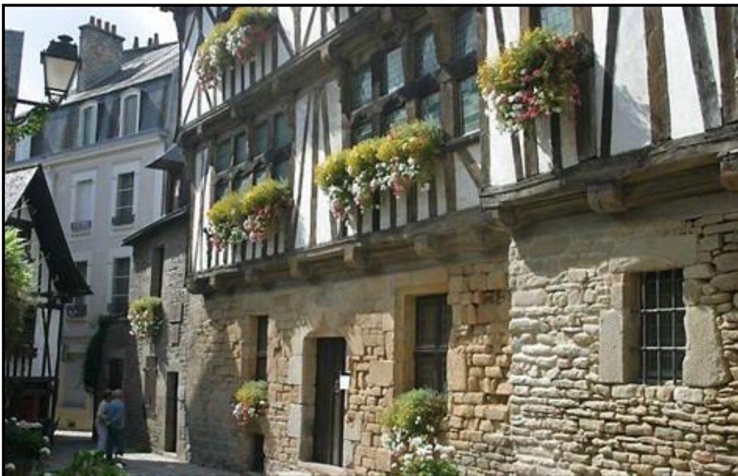
Maison des Archers, Classé Monument Historique, entrée des visiteurs

L'étage supérieur, en encorbellement sur une sablière, est composé d'un gracieux entrelacs de bois verticaux et de poteaux raidisseurs disposés en épi dont le dessin ainsi formé est appelé brin de fougère.