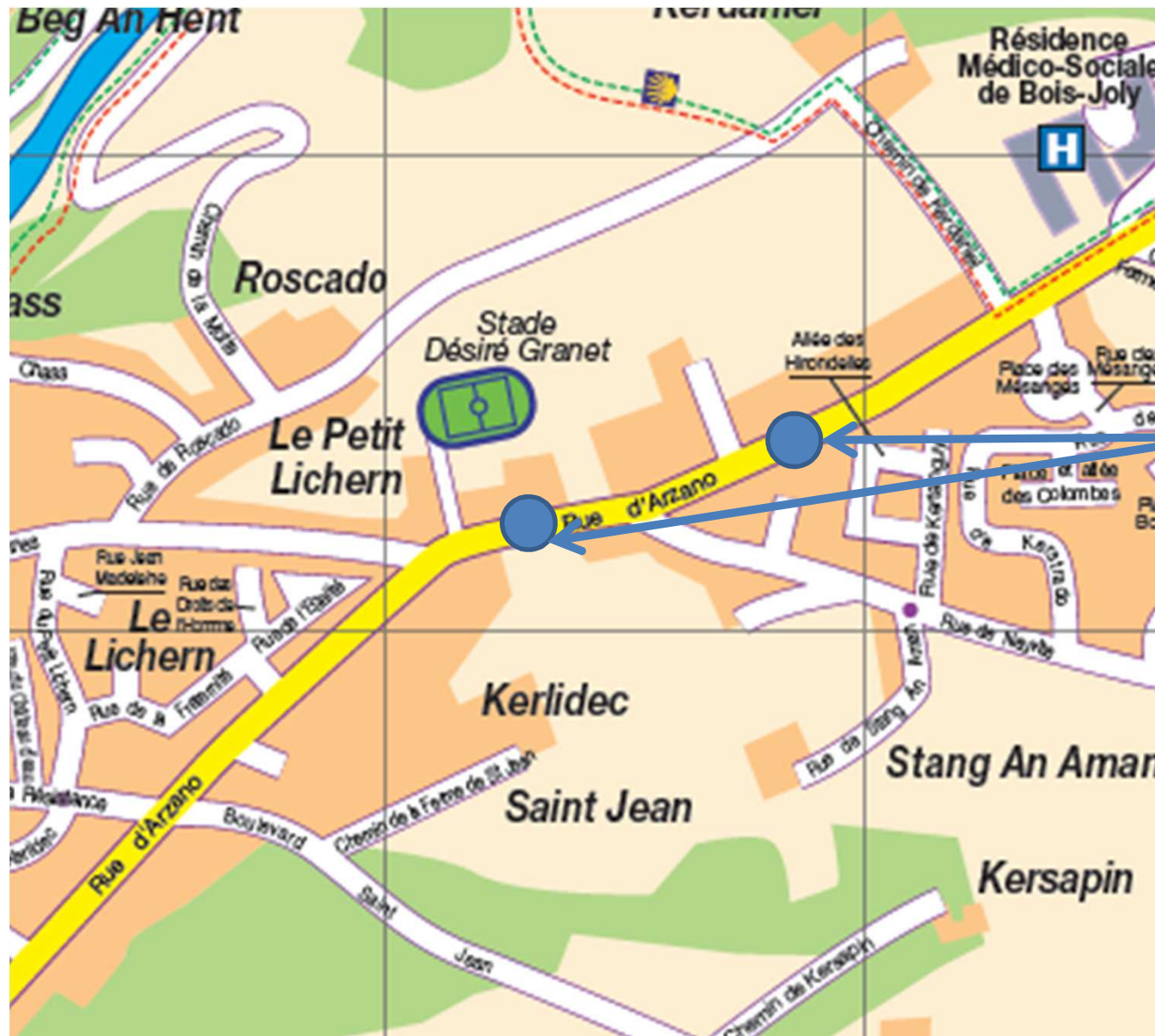
Aménagements de sécurité route d'Arzano ( x2)