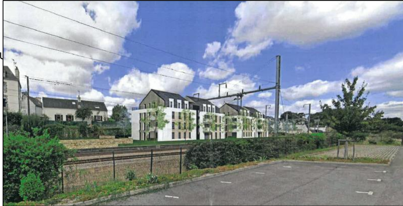
Îlot Saint-Yves – vue depuis le parking de la gare