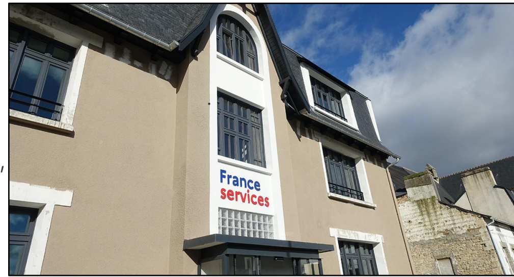
1 rue des Gorgennes, Quimperlé

D'autres acteurs pour vous accompagner : CCAS, CDAS (Place st Michel)