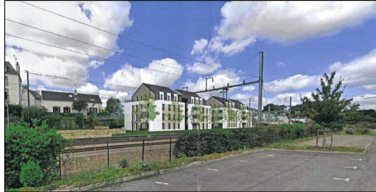
Îlot Saint-Yves – vue depuis le parking de la gare