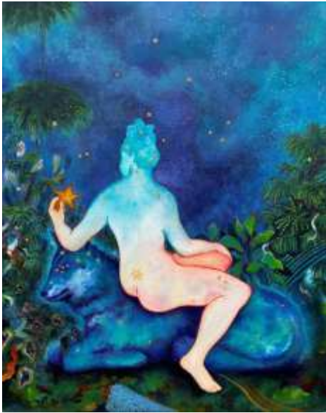
Image de couverture et ci-dessus La Loba , 2024