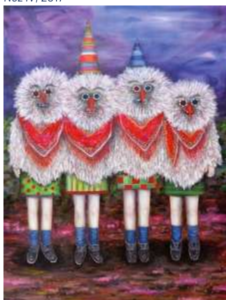
Mondfänger II, 2016