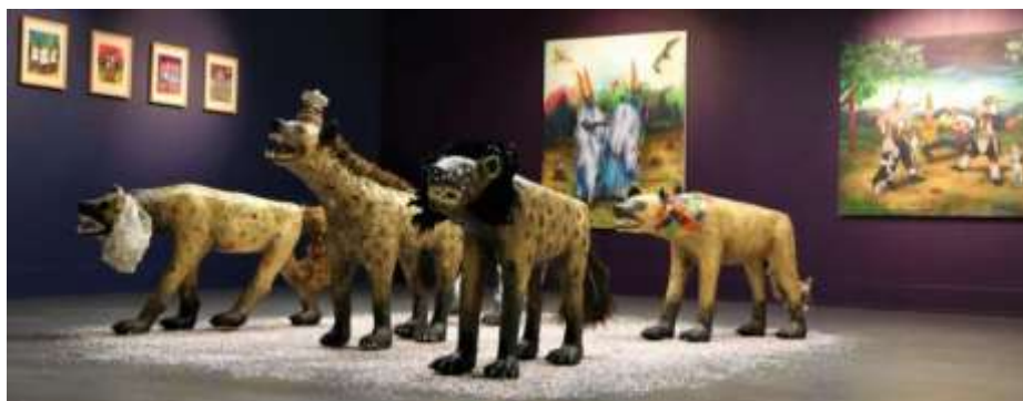
Le Fléau , groupe de sculptures de hyènes en papier mâché, du cycle des parcs d'attraction devant les tableaux de la série des pèlerins

Depuis 2019, elle vit et travaille à Fouesnant.