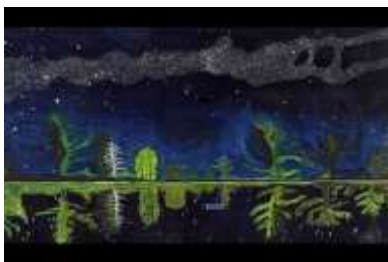
Milky way, 1990, Peter Doig