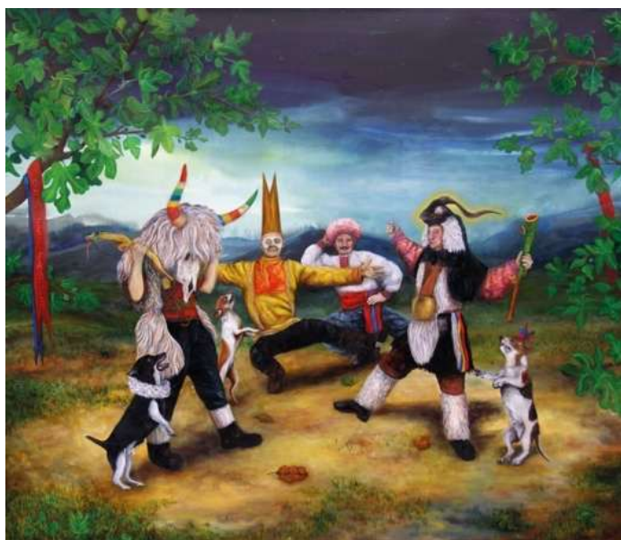
Acta est Fabula, 2015