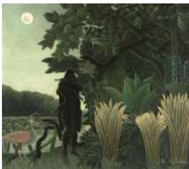
La charmeuse de serpent, Henri Rousseau, 1907