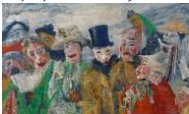
L'intrigue, James Ensor, 1890