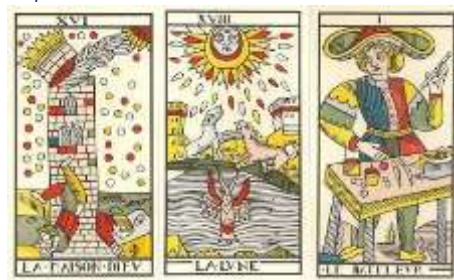
Tarot de Marseille