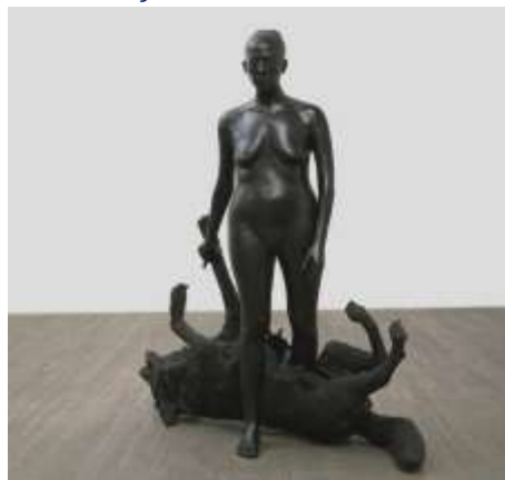
Rapture, 2001, Kiki Smith