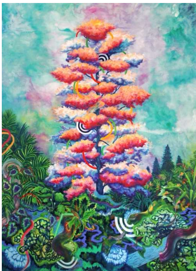
Tree 1, 2021