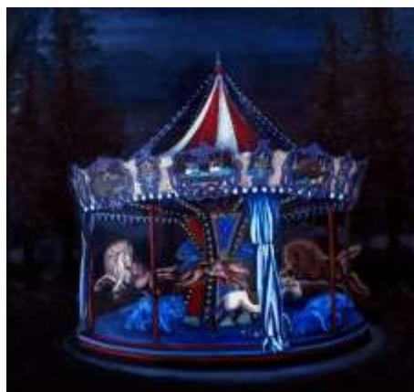
Manège 2, 2014

L'artiste nous invite à « tomber le masque » pour être nous-mêmes, sans faux-semblants .