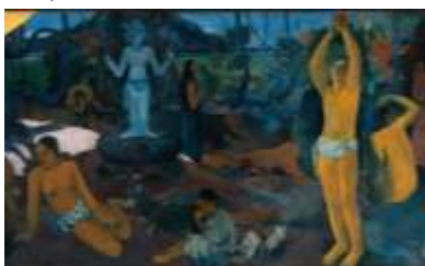
D'où venons-nous, qui sommes-nous, où allons-nous (détail), 1897, Paul Gauguin