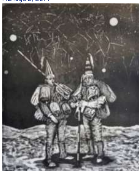
Noz IV, 2017