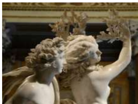
Apollon et Daphné, 1622, Le Bernin

Le tarot inspire aussi l'artiste. Il renvoie à tout un univers de forces invisibles et mystérieuses qu'il est possible de rapprocher des inspirations chamaniques 1 présentes dans ses œuvres : costumes et masques rituels, danses, animaux totémiques 2 , importance de la nature sauvage, motifs ou couleurs vives, etc.