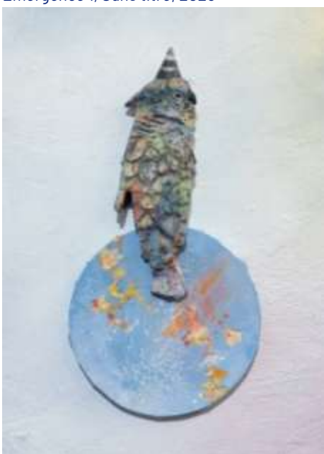
Hors champs (détail), 2025