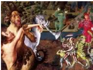
La tentation de saint Antoine (détail), 1501, Jérôme Bosch