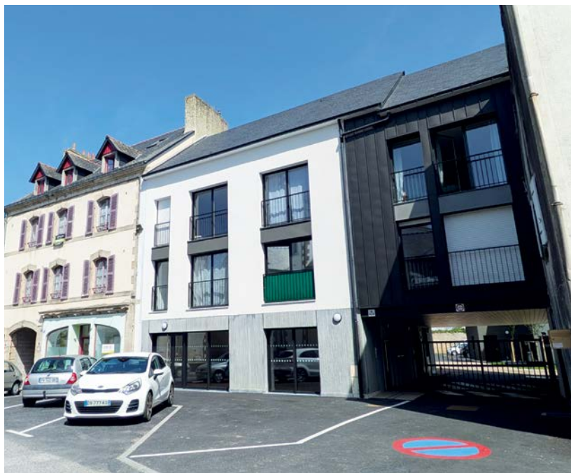
24 logements ont vu le jour en cœur de ville dans la résidence inclusive rue Leuriou

En 2019, j'ai déposé un dossier de demande de logement social auprès de l'OPAC de Quimper Cornouaille car j'ai eu des problèmes de santé et mon logement au Trévoux n'était plus adapté à mon handicap. Après avoir rencontré les représentants du CCAS de la Ville en 2025, un logement m'a été attribué en novembre pour un appartement de la place Hervo que j'ai pu intégrer fin décembre. Je marche avec une canne mais j'étais d'accord pour un appartement au 1 er étage. Vivant seul, il s'agit d'un T2 de 49 m 2 . J'habite en plein centre-ville, proche des commodités et je peux me garer sur le parking Isole-Sainte-Croix. C'est un quartier vivant ! J'ai toujours vécu en campagne et j'habitais à 4 km du bourg, il fallait prendre la voiture pour aller faire la moindre course. Ici, je suis à côté de la boulangerie, des commerces... Je me sens très bien dans mon appartement. ●