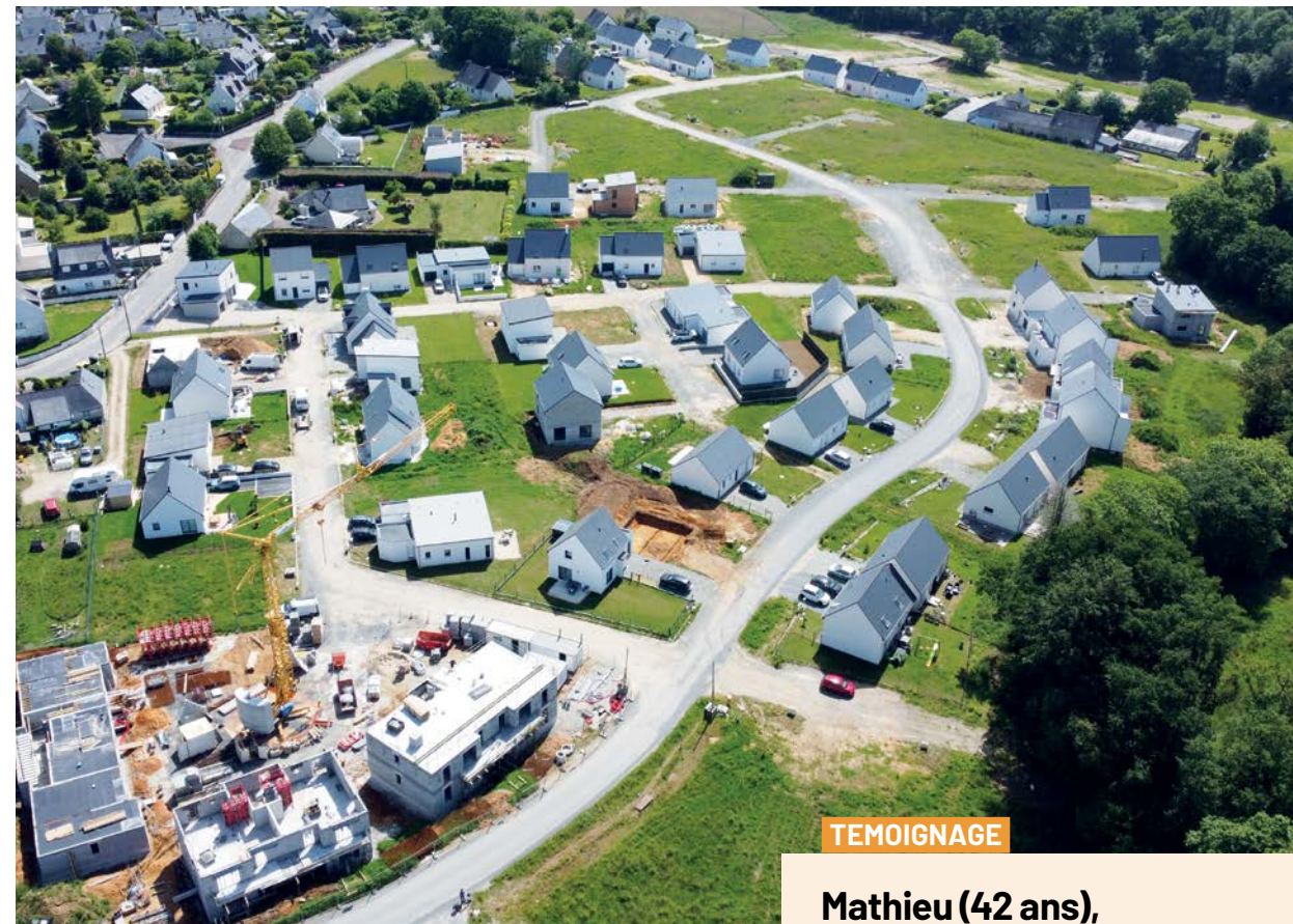
Plusieurs logements sont déjà sortis de terre dans le nouveau quartier de Stang an aman

Les dernières opérations l'ont bien montré, les bailleurs sociaux sont pleinement mobilisés pour construire de nouveaux logements adaptés dans notre cité.