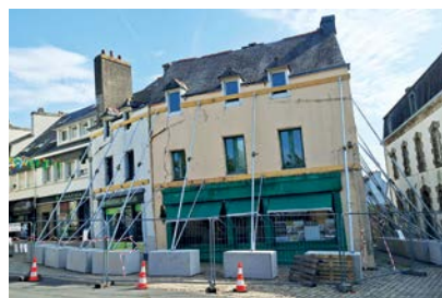
POLICE MUNICIPALE Des caméras sur les agents