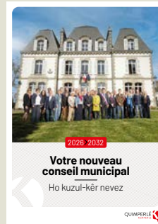
2026-2032 Votre nouveau conseil municipal Ho kuzul-kêr nevez