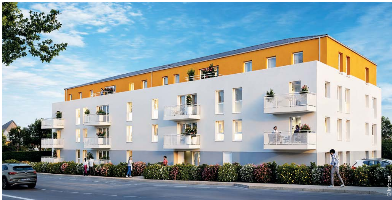
Les promoteurs privés reviennent à Quimperlé, comme le montre le projet d'Axiom, Presqu'île Investissement et de l'OPAC rue de Pont-Aven.