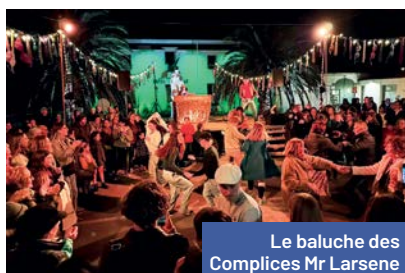
Le baluche des Complices Mr Larsene